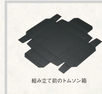
組み立て前のトムソン箱