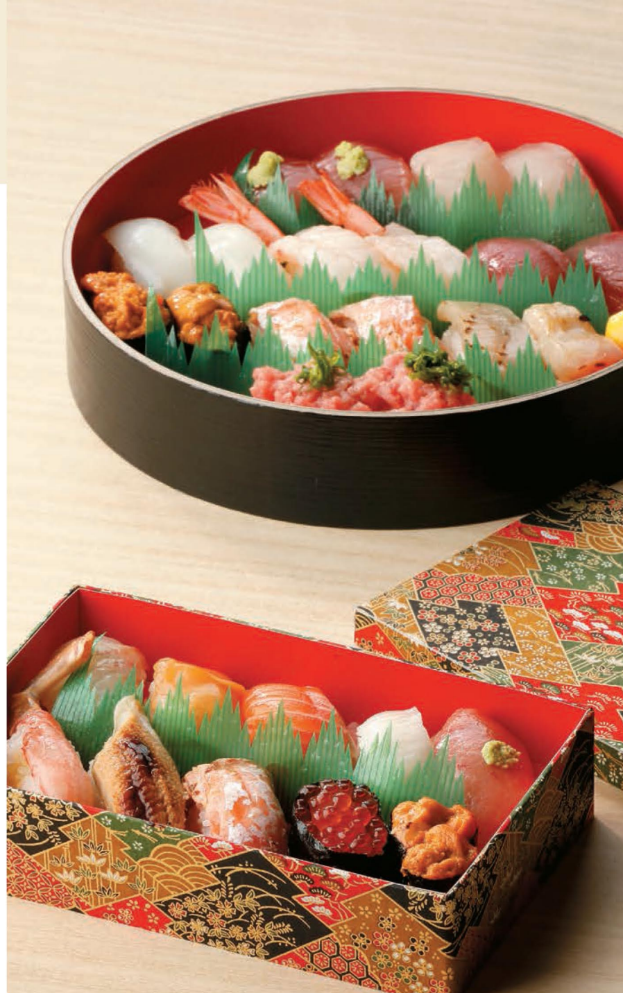
写真上: 寿司桶(中) 写真下: ちらし・にぎり寿司箱(10貫折)/友禅No.3382