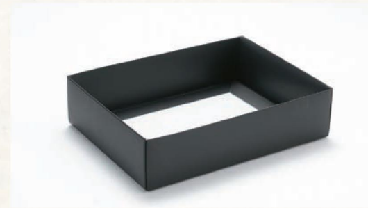
色は黒のみとなります。